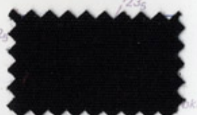
Jet Black - 5032 [Black]