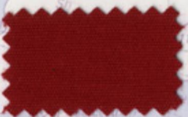
Jockey Red - 5029 [Paris Red]