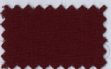
Burgundy - 5034