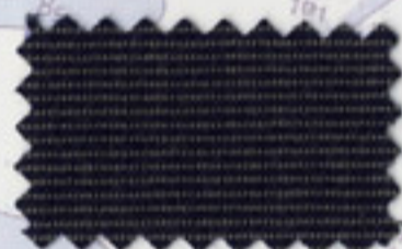
Silver Blue - 5070