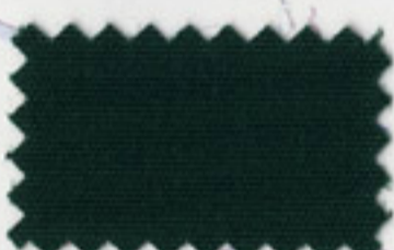
Forest Green - 5040