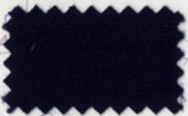
Captain Navy - 5057