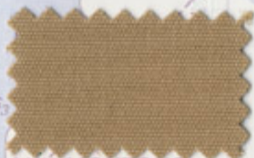
ILE AUX MOUTONS Dune - 5026