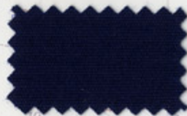
Marine Blue - 5031