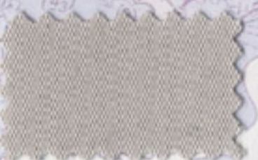
Silver - 5035