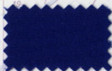
Ocean Blue - 5055