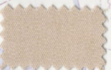
Oyster - 5030