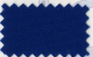
Pacific Blue - 5023