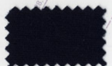
Navy Blue - 5058