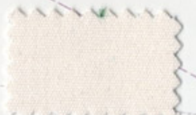
Natural - 5020 [White]