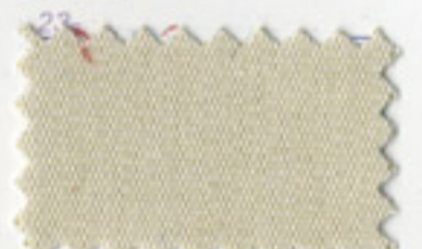
Pastel Mint - 5062